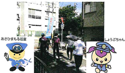
あさひまもる巡査