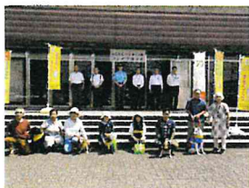
「熊取町わんだふるくらぶ」へのバンドナ贈呈式