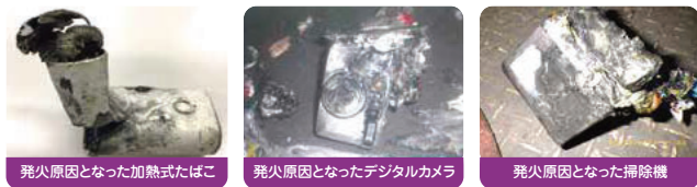
発火原因となった加熱式たばこ 発火原因となったデジタルカメラ 発火原因となった掃除機